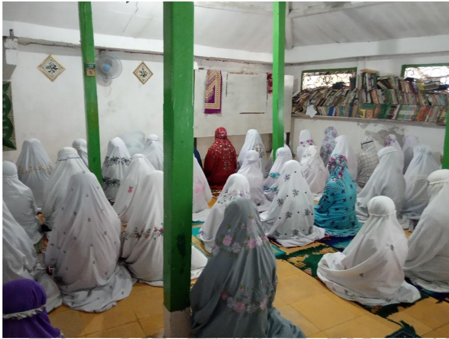
Jama'ah sholat maktubah santri Pondok Pesantren Al Falah Pacul Bojonegoro