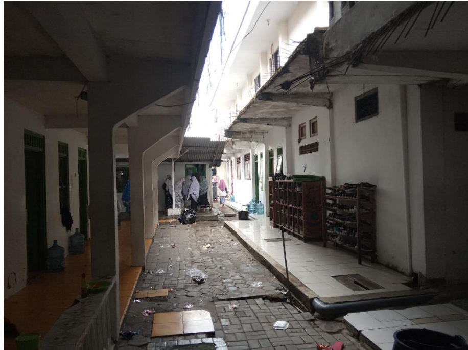
Lingkungan santri Pondok Pesantren Al Falah Pacul Bojonegoro