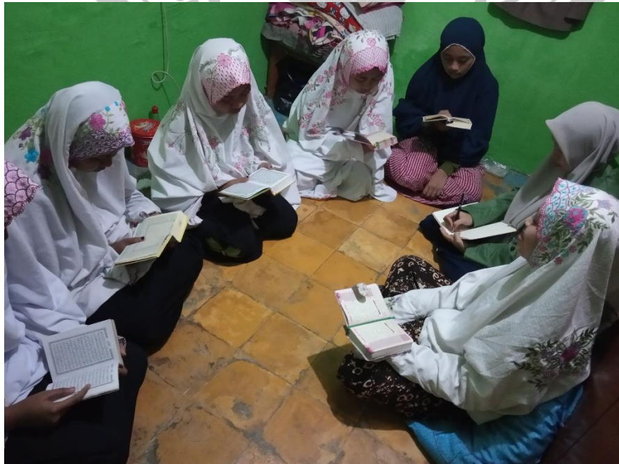
Muroja'ah santri tahfidz Pondok Pesantren Al Falah Pacul Bojonegoro