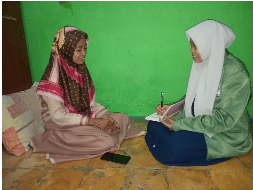
Wawancara dengan ustadzah di asrama tahfidz Pesantren Al Falah Pacul Bojonegoro