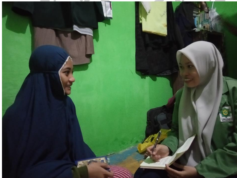
Wawancara dengan salah satu santri tahfidz di Pesantren Al Falah Pacul Bojonegoro