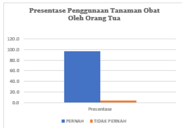
Gambar 1. Presentase Penggunaan Tanaman Obat Oleh Orang Tua di RT 10 Rw 04 Desa Baureno, Kecamatan Baureno, Kabupaten Bojonegoro

Pada hasil penelitian yang di gambarkan pada Tabel 1 dan Gambar 1 Dapat kita ketahui terdapat 55 orang tua yang bertindak sebagai responden (96,5%) telah menggunakan tanaman obat yang terdapat disekitar mereka dalam mengobati beberapa penyakit yang ada ditengah