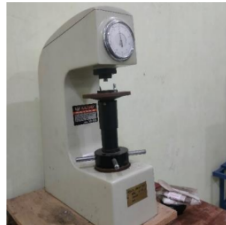
Gambar 4. Rockwell Hardness test