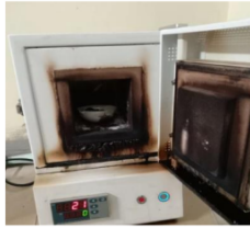
Gambar 1. Pemanasan Bahan Uji menggunakan Furnace

Setelah dilakukan pembuatan spesimen uji dengan proses heat treatment maka dipastikan kelayakan pada benda kerja agar terhindar dari cacat pada material seperti retak. selanjutnya dibuat spesimen uji dan dilakukan pengujian kekerasan yang ditunjukkan pada Gambar 2.