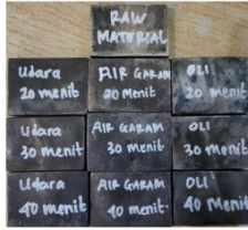
Gambar 2. Bahan Uji untuk Pengujian Kekerasan

Selanjutnya, langkah yang dilakukan adalah melakukan pengujian kekerasan rockwell hardness test (HRB) yang dilakukan pada 4 titik pengujian dan dilakukan pengambilan nilai rata-rata kekerasan untuk menyatakan nilai kekerasan dan dilakukan analisis data penelitian.