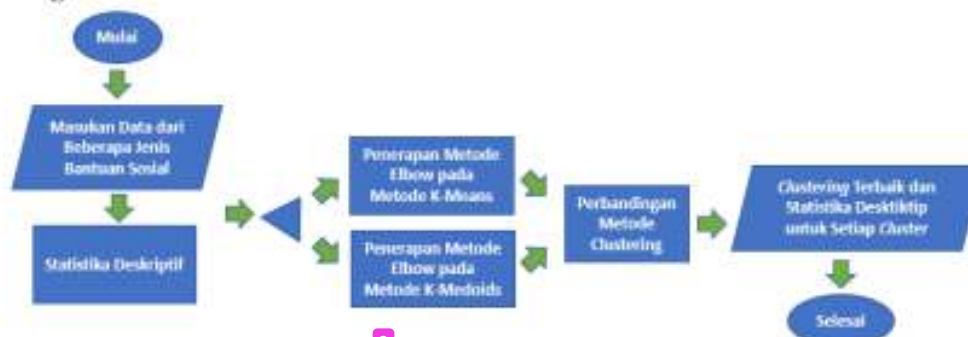
Gambar 1. Diagram Alir untuk Analisis Data.