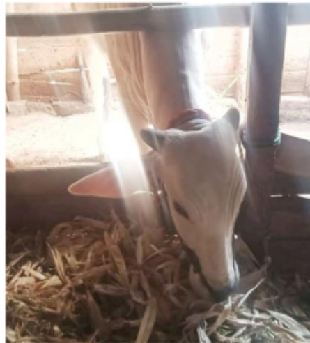
Gambar 1. 1 Limbah Kulit Jagung sebagai Pakan Ternak

Tanaman jagung merupakan tanaman yang mempunyai banyak kegunaan dalam produksi pangan. Produksi pangan yang dihasilkan dari jagung memanfaatkan biji jagung yang dihasilkan. Sedangkan kulit jagung, tongkol jagung, dan limbah jagung lainnya umumnya dibakar atau digunakan sebagai pakan ternak seperti pada gambar 1.1. Pembakaran limbah jagung yang hasilnya tidak dimanfaatkan oleh orang awam sebenarnya memiliki manfaat yang lebih jika limbah jagung tersebut diolah menjadi produk lain seperti karbon atau karbon aktif.