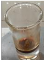
Gambar 1. Ekstrak Salak Wedi

Ekstrak kulit salak yang dihasilkan dari 250 gram serbuk kuliut salak sebesar 37,74 gram dengan rendemen sebesar 15,09%. Rendemen merupakan perbandingan berat ekstrak yang dihasilkan dengan jumlah serbuk simplisia. Nilai rendemen berkaitan dengan banyaknya kandungan bioaktif yang terkandung. Nilai rendemen dipengaruhi oleh lama waktu ekstraksi (Senduk et al. , 2020). Pada penelitian ini, waktu ekstraksi hanya 3 hari, sehingga rendemen yang dihasilkan diatas 10%. Ekstrak kulit salak yang dihasilkan berbentuk kental, berwarna coklat dan memiliki bau khas salak, seperti yang disajikan pada gambar 1. Ekstrak memiliki bentuk kental karena proses pemekatan menggunakan rotary evaporator diakhiri sampai ekstrak yang dihasilkan tidak mengandung pelarut.