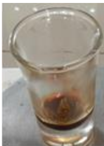
Gambar 1. Ekstrak Salak Wedi

Ekstrak kulit salak yang dihasilkan dari 250 gram serbuk kuliut salak sebesar 37,74 gram dengan rendemen sebesar 15,09%. Rendemen merupakan perbandingan berat ekstrak yang dihasilkan dengan jumlah serbuk simplisia. Nilai rendemen berkaitan dengan banyaknya kandungan bioaktif yang terkandung. Nilai rendemen dipengaruhi oleh lama waktu ekstraksi (Senduk et al. , 2020). Pada penelitian ini, waktu ekstraksi hanya 3 hari, sehingga rendemen yang dihasilkan diatas 10%. Ekstrak kulit salak yang dihasilkan berbentuk kental, berwarna coklat dan memiliki bau khas salak, seperti yang disajikan pada gambar 1. Ekstrak memiliki bentuk kental karena proses pemekatan menggunakan rotary evaporator diakhiri sampai ekstrak yang dihasilkan tidak mengandung pelarut.