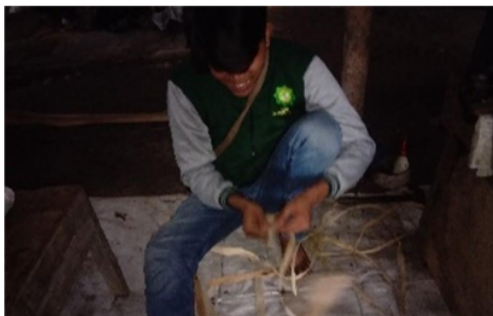
Proses pemotongan batang pohon pisang