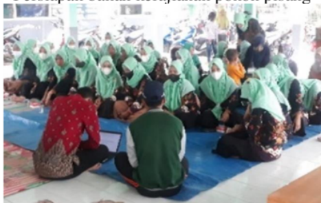
Kegiatan penyuluhan dan pelatihan