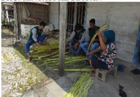
Persiapan bahan kerajinan pohon pisang