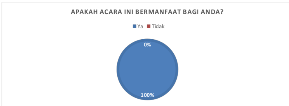
Gambar 2. Hasil Instrumen Kepuasan Peserta Pertanyaan No 2