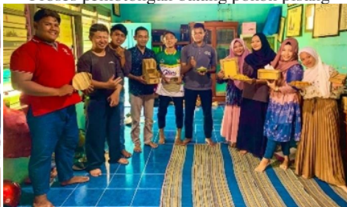
Penyerahan hasil kerajinan kepada warga