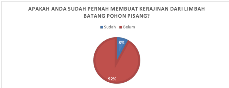
Gambar 1. Hasil Instrumen Kepuasan Peserta Pertanyaan No 1

Pada tahap akhir disebarkan instrumen angket kepuasan peserta untuk mengetahui kepuasan masyarakat terhadap keseluruhan kegiatan serta mengukur tingkat keberhasilan dari kegiatan ini. Pertanyaan dalam instrumen penelitian ini diambil dari beberapa literatur pengabdian kepada masyarakat (Fathoni et al., 2021; Nihayah et al., 2021, 2022). Hasil instrumen kepuasan oleh peserta ditunjukkan oleh diagram-diagram pada Gambar 1-4.