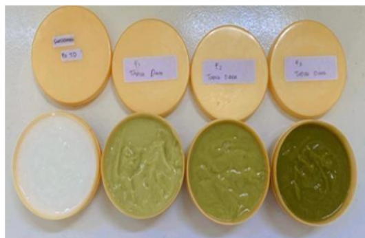
Gambar 1. Krim tabir surya ekstrak etanol daun tapak dara hasil formulasi. Ket. Berurutan kiri ke kanan adalah formulasi F 0 , F 1 , F 2 dan F 3

Berdasarkan hasil pembuatan krim tabir surya dengan ekstrak tapak dara, terlihat bahwa semakin tinggi konsentrasi ekstrak yang digunakan, maka semakin pekat warna krim tabir surya yang dihasilkan. Pada Gambar 2, terlihat bahwa formula dasar F 0 memiliki warna putih, tidak berbau, dan berbentuk semi-solid. Sementara itu, formula F 1 , F 2 , dan F 3 memiliki warna hijau muda, hijau tua, dan hijau pekat, yang masing-masing memiliki aroma khas daun tapak dara dan berbentuk semi-solid. Perubahan warna krim tabir surya dipengaruhi oleh konsentrasi ekstrak etanol daun tapak dara, dimana semakin tinggi konsentrasinya maka warna akan semakin pekat. Hal ini sesuai dengan penelitian yang dilakukan oleh Sugihartini (2022) yang menyatakan bahwa semakin tinggi konsentrasi ekstrak maka intensitas warna yang ditemukan pada krim meningkat (Sugihartini & Wiradhika, 2017).