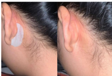
Gambar 2. Hasil Uji Iritasi