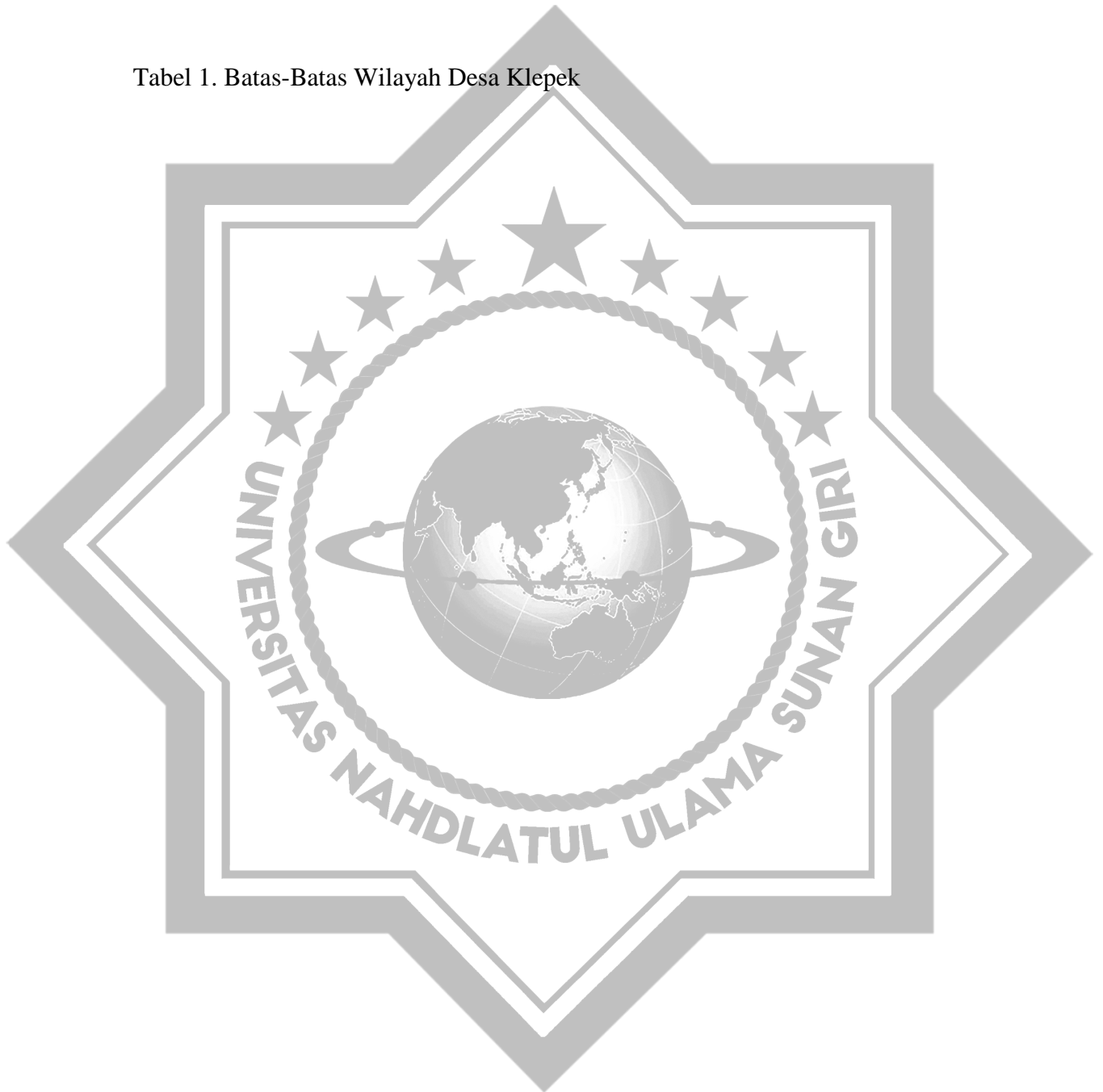
Tabel 1. Batas-Batas Wilayah Desa Klepek