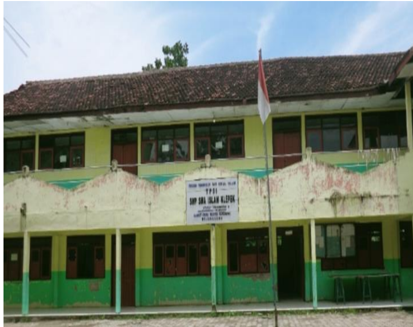
Sekolah Menengah Swasta Islam Klepek Sukosewu Bojonegoro