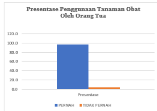
Gambar 1. Presentase Penggunaan Tanaman Obat Oleh Orang Tua di RT 10 Rw 04 Desa Baureno, Kecamatan Baureno, Kabupaten Bojonegoro

Pada hasil penelitian yang di gambarkan pada Tabel 1 dan Gambar 1 Dapat kita ketahui terdapat 55 orang tua yang bertindak sebagai responden (96,5%) telah menggunakan tanaman obat yang terdapat disekitar mereka dalam mengobati beberapa penyakit yang ada ditengah