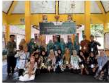
Gambar 1. Pelatihan produk bawang merah.

Pelatihan pembuatan produk Gapit Dan Stick Dari Bawang Merah diberikan untuk pengenalan atau penjelasan terkait manfaat bawang merah yang sering tertimbun hingga membusuk untuk diolah sebagai produk makanan ringan, menjelaskan alat-alat yang digunakan, dan bahan pelengkap yang diperlukan untuk membuat Gapit Dan Stick Bawang Merah, serta penjelasan pembuatan Gapit Dan Stick Bawang Merah pada setiap tahapannya. Pengolahan bahan mentah menjadi bahan matang berupa Gapit Dan Stick Bawang Merah tidak cukup hanya sosialisasi saja, maka perlu diberikan juga praktik secara langsung pembuatan Gapit Dan Stick dari bahan mentah sampai menjadi Gapit Dan Stick Bawang Merah. Mengingat masih banyak yang belum mengetahui produk ini sehingga mengundang rasa penasaran dan minat masyarakat untuk membeli dan mengkonsumsi produk Gapit dan Stick Bawang Merah ini. Demikian produk ini menjadi salah satu produk yang bernilai ekonomi Praktik Pengolahan Gapit Dan Stick Bawang Merah, Pengemasan, dan Pemasaran