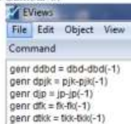
Gambar 6. Perintah Eviews untuk melakukan proses differencing pada lag-1.

Dari Tabel 2, diperoleh hasil pengujian bahwa terdapat beberapa series yang tidak stasioner seperti pada series JP dan FK . Demikian hingga, semua series akan diberikan perlakuan differencing pada lag-1 seperti pada Gambar 6.