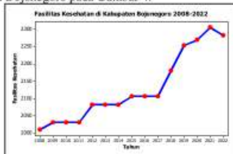
Gambar 4. Time series plot untuk fasilitas kesehatan di Kabupaten Bojonegoro.

Pada Gambar 3, diberikan gambar bahwa jumlah penduduk di Kabupaten Bojonegoro memiliki pola pergerakan series dengan pola tren peningkatan di setiap tahunnya yang mana peningkatan ini terjadi sampai tahun 2022 yang tercatat sebesar 1.350.650 orang. Dari peningkatan jumlah penduduk ini seharusnya diimbangi juga dengan peningkatan fasilitas kesehatan dan tenaga kerja kesehatan. Berikut diberikan time series plot untuk data fasilitas kesehatan di Kabupaten Bojonegoro pada Gambar 4.