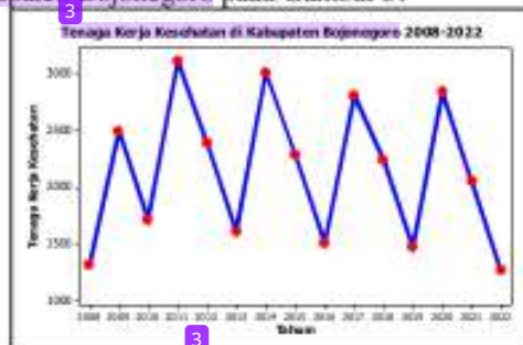
Gambar 5. Time series plot untuk tenaga kerja kesehatan di Kabupaten Bojonegoro.

Pada Gambar 4, dihasilkan gambar bahwa jumlah fasilitas kesehatan di Kabupaten Bojonegoro memiliki pola pergerakan series dengan pola tren peningkatan di setiap tahunnya yang mana peningkatan ini terjadi sampai tahun 2022 yang tercatat sudah ada 2.282 yang dihitung dari banyaknya Rumah Sakit, Rumah Sakit Bersalin, Poliklinik, Puskesmas, Puskesmas pembantu, Posyandu, Klinik, Polindes, dan Apotek. Peningkatan jumlah fasilitas kesehatan ini sejalan dengan tren peningkatan dari jumlah penduduk di Kabupaten Bojonegoro. Peningkatan fasilitas kesehatan ini membuka lapangan kerja bagi tenaga kerja kesehatan di Kabupaten Bojonegoro. Berikut diberikan time series plot untuk data tenaga kerja kesehatan di Kabupaten Bojonegoro pada Gambar 5.