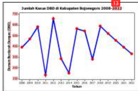
Gambar 1. Time series plot untuk jumlah kasus DBD di Kabupaten Bojonegoro.

Pada Gambar 1, ditunjukkan gambar bahwa Kasus DBD di Kabupaten Bojonegoro memiliki pola pergerakan series yang bergelombang seperti pola musiman 3 tahunan. Jumlah penderita kasus DBD masih banyak dengan penurunan dalam lima tahun terakhir yaitu pada tahun 2018 sampai 2022 masing-masing sebesar 589, 519, 456, 392, dan 331 kasus. Terkadang kasus DBD ini dikaitkan dengan kondisi kemiskinan yang mana masih perlu diuji kebenarannya di Kabupaten Bojonegoro. Berikut diberikan time series plot untuk data persentase jumlah kemiskinan di Kabupaten Bojonegoro pada Gambar 2.