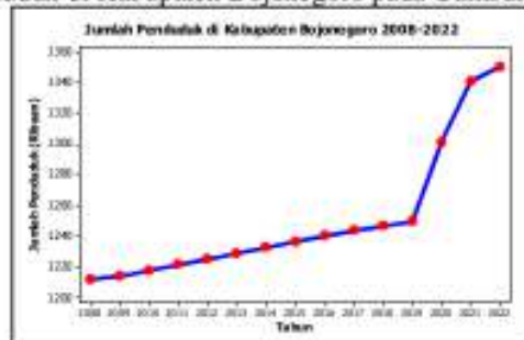
Gambar 3. Time series plot untuk jumlah penduduk di Kabupaten Bojonegoro.

Pada Gambar 2, disajikan gambar bahwa kemiskinan di Kabupaten Bojonegoro memiliki pola pergerakan series dengan pola tren penurunan di setiap tahunnya yang mana penurunan ini terjadi sampai tahun 2022 yang tercatat sebesar 12,21% jumlah penduduk miskin di Kabupaten Bojonegoro. Jumlah penduduk di suatu daerah juga menjadi variabel penting yang perlu diselidiki dalam kasus DBD karena penyebaran virus DBD bisa menular cepat dari satu orang ke orang lain melalui gigitan nyamuk Aedes Aegypti . Berikut diberikan time series plot untuk data jumlah penduduk di Kabupaten Bojonegoro pada Gambar 3.