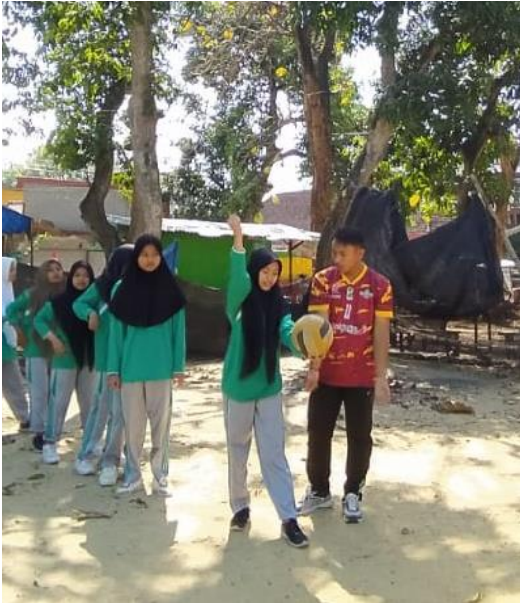
Gambar 5.15 Treatmen pertama