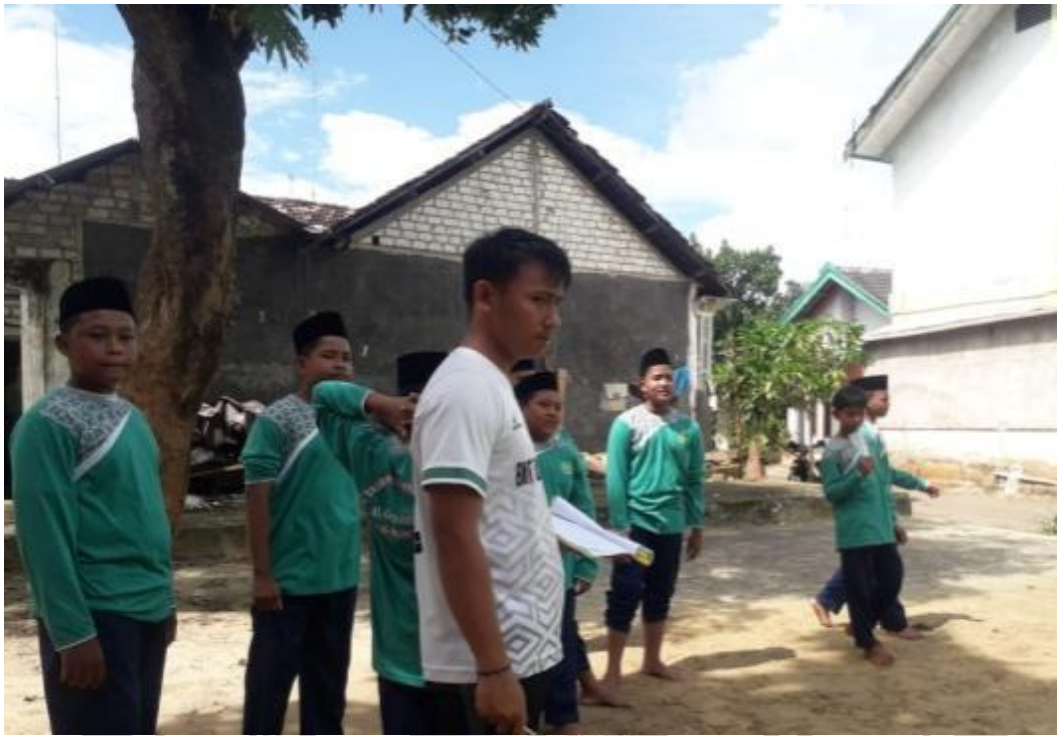
Gambar 5.6 Pengambilan nilai awal