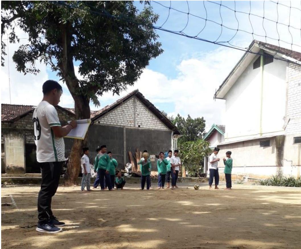
Gambar 5.8 Pengambilan nilai awal