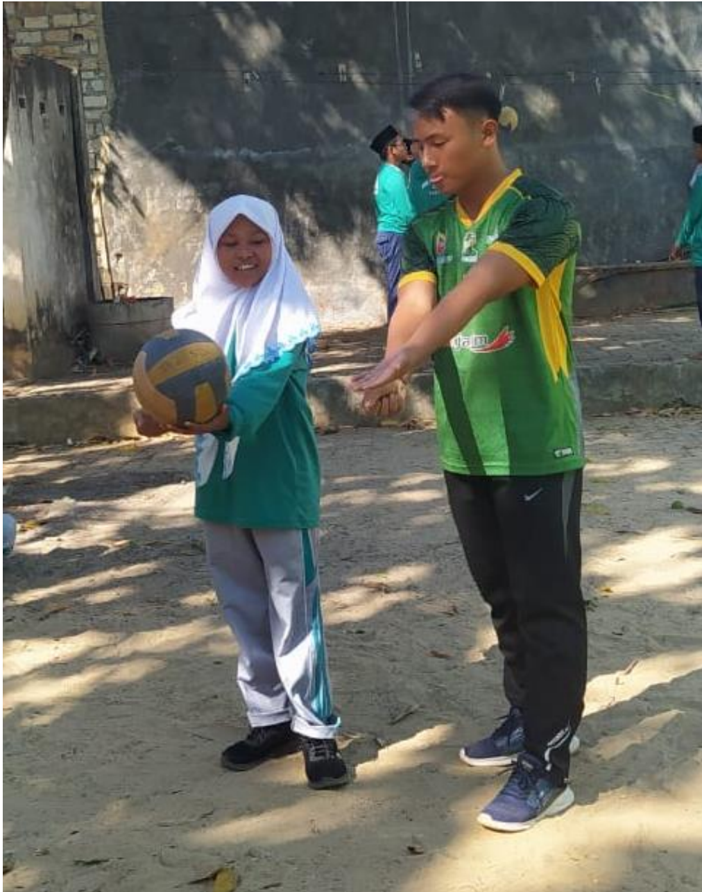
Gambar 5.17 Treatmen kedua