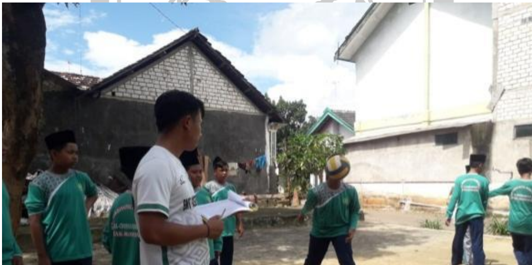
Gambar 5.7 Pengambilan nilai awal