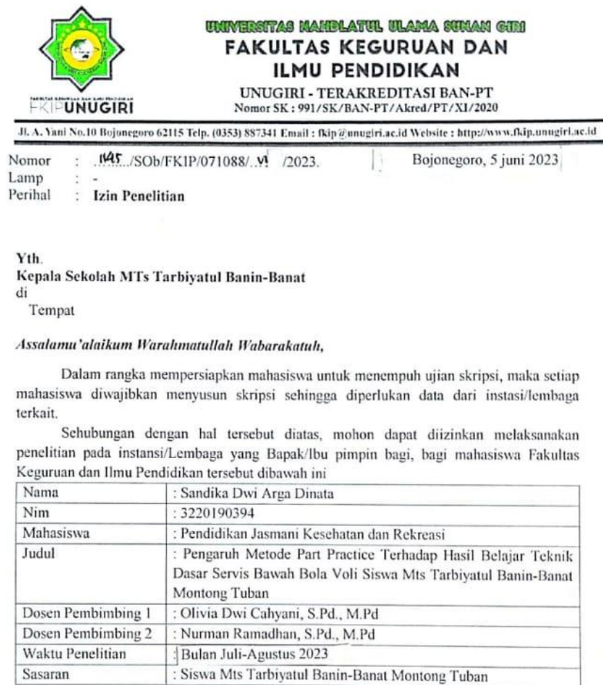
Gambar 5.2 Scan surat penelitian