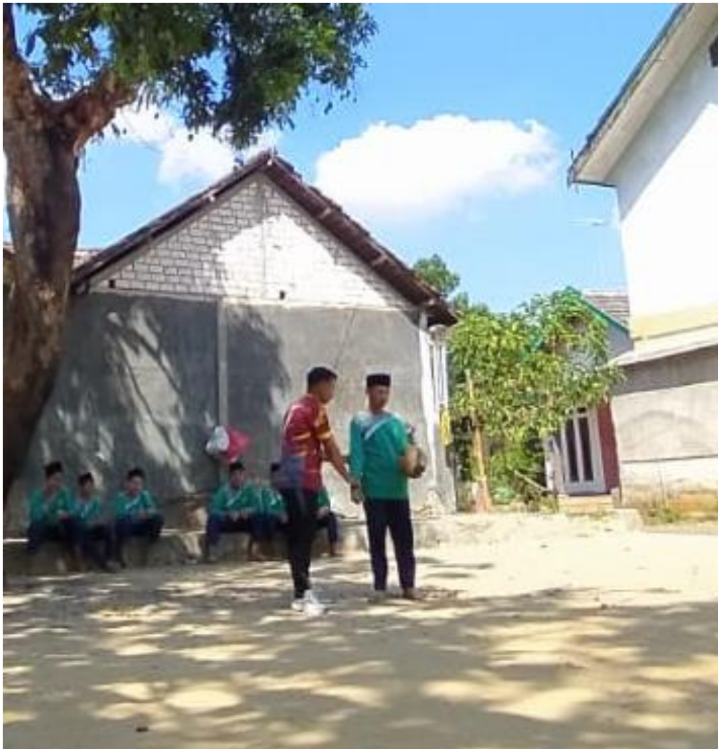
Gambar 5.12 Treatmen pertama