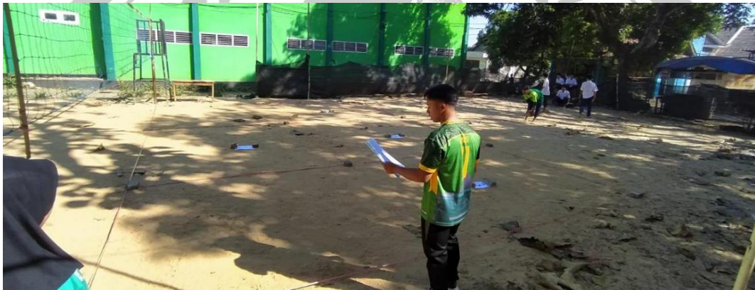
Gambar 5.11 pengambilan nilai akhir