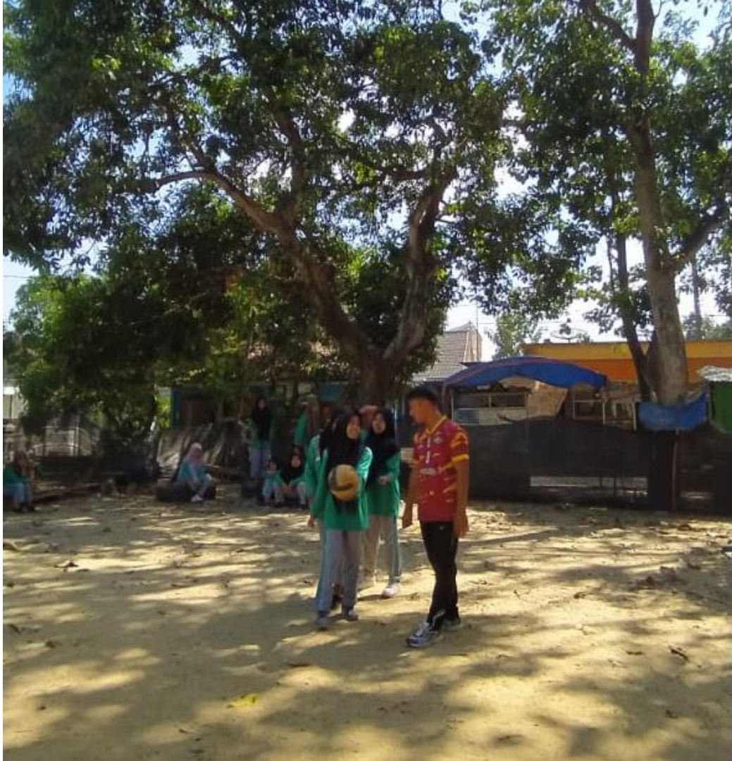
Gambar 5.13 Treatmen pertama