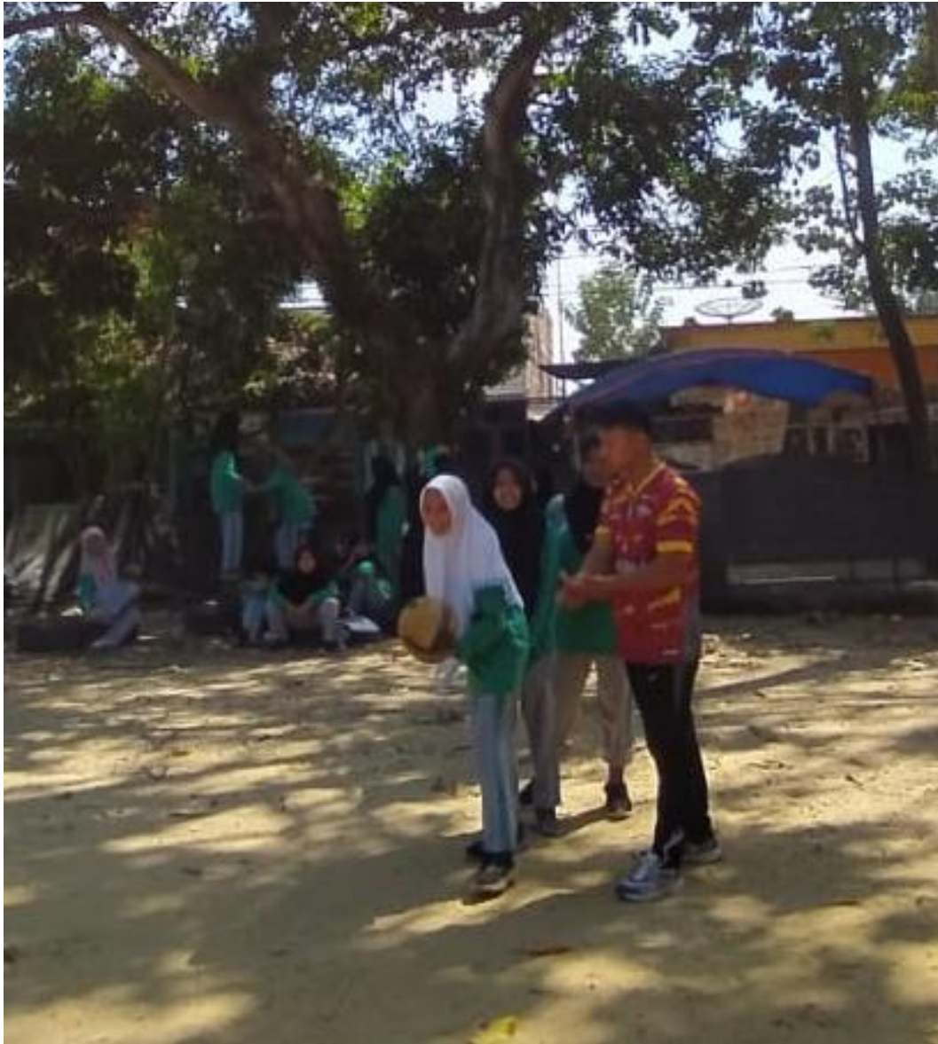
Gambar 5.14 Treatmen pertama