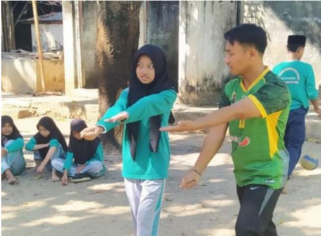
Gambar 5.19 Treatmen kedua