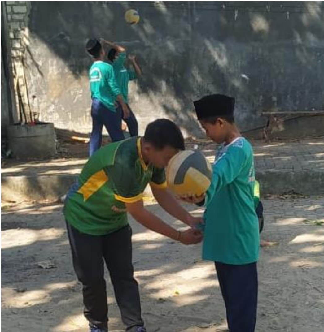
Gambar 5.16 Treatmen kedua