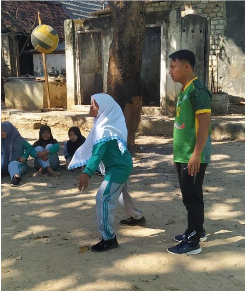
Gambar 5.18 Treatmen kedua