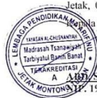
Gambar 5.3 Scan surat balasan penelitian