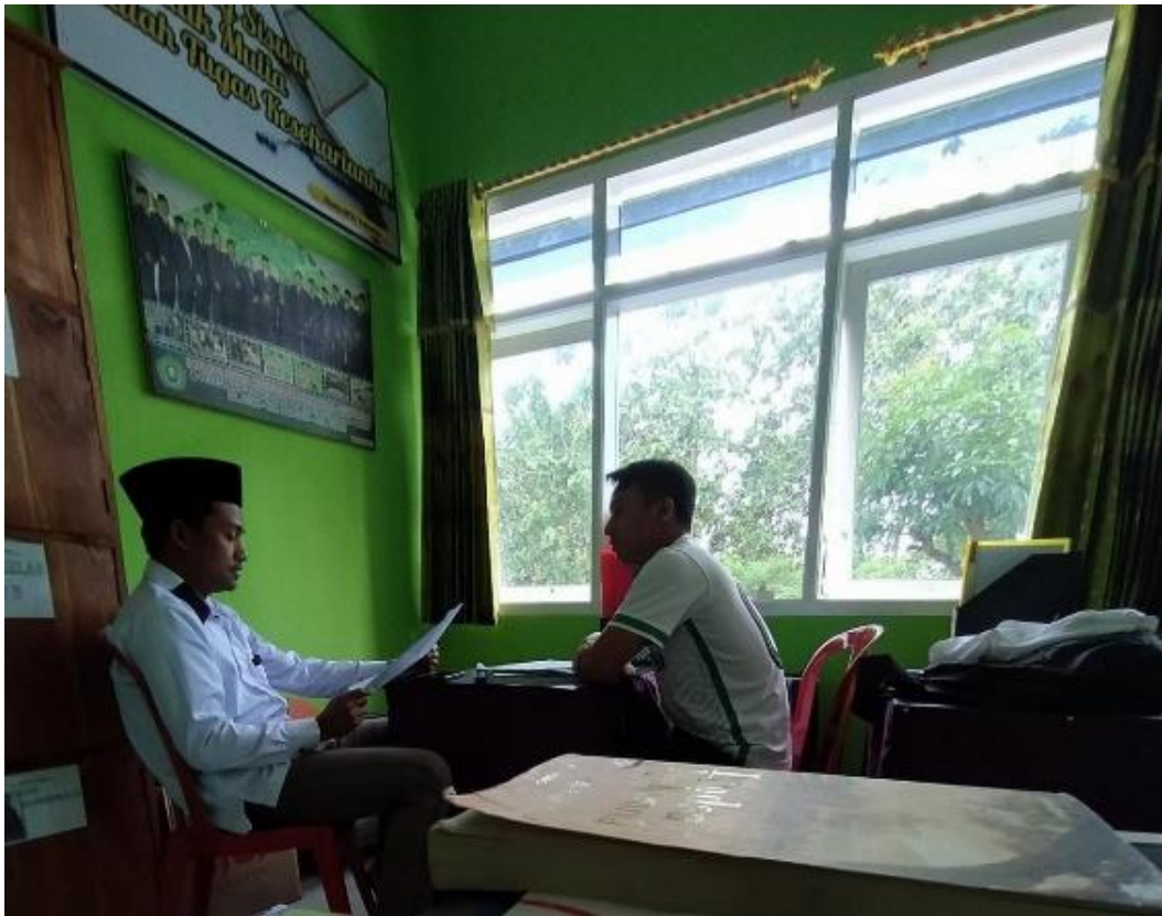
Gambar 5.1 Wawancara dengan guru PJOK MTs TBB