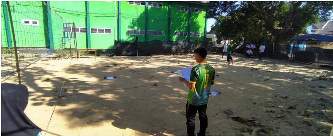
Gambar 5.10 Pengambilan nilai akhir