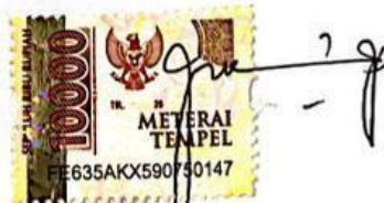
Fitria Dwi Ningsih