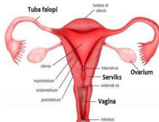
Gambar 2. Alat Genitalia Interna.

Alat genitalia eksterna terdiri atas: Pertama, Mons veneris adalah bagian yang menonjol dibagian depan simfisis, terdiri dari jaringan lemak dan sedikit jaringan ikat. Kedua, Labia mayora (bibir besar) adalah bagian lanjutan dari mons veneris yang berbentuk lonjong. Kedua bibir ini akan bertemu dan membentuk perineum. Bibir ini mengandung kelenjar sebacea (lemak). Ketiga, Labia minora (bibir kecil) adalah lipatan dibagian dalam bibir besar tanpa rambut. Di atas klitoris bibir ini bertemu dan membentuk prepusium klitoridis dan bawahnya bertemu membentuk prenulum klitoridis. Bibir ini mengelilingi orifisium vagina. Keempat, Klitoris, terletak di bawah prepusium klitoridis dan diatas orifisium uretralis. Kelima, Vestibulum dibatasi oleh bibir kecil, bagian atas klitoris, di bagian belakang (bawah) pertemuan dua bibir kecil. Bermuara pada uretra, dua lubang kelenjar bartholini dan kedua lubang saluran skene. Keenam, Hymen (selaput dara), jaringan yang menutupi lubang vagina. Dan ketujuh, Kelenjar Bartholini dan skene.