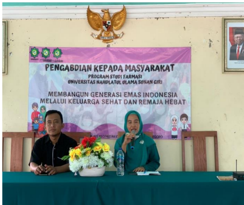
Gambar 3. Sosialisasi Kesehatan Reproduksi Remaja.