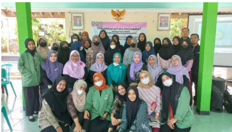
Gambar 4. Pemateri dan Peserta sosialisasi.

Setelah dilakukan sosialisasi memperoleh informasi yang tepat mengenai kesehatan reproduksi dan memahami serta dapat melaksanakan dalam kehidupan sehari-hari untuk meningkatkan kesehatan remaja khususnya kesehatan reproduksi. Kegiatan ini mempunyai manfaat membantu masyarakat khususnya remaja untuk meningkatkan pengetahuannya, dan mampu menangani masalahnya secara tepat. remaja memperoleh informasi yang tepat mengenai kesehatan reproduksi dan memahami serta dapat melaksanakan dalam kehidupan sehari-hari untuk meningkatkan kesehatan remaja khususnya kesehatan reproduksi.